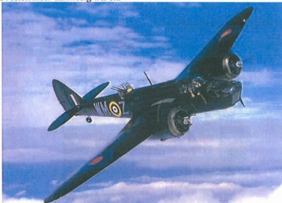
Een gerestaureerde Blenheim IV. De roundel is duidelijk zichtbaar.

De Vliegtuigbergingsdienst heeft toen vastgesteld, dat het een Blenheim IV was en dat er geen stoffelijke resten meer aanwezig waren.