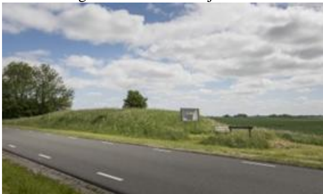
Tussen Den Andel en Westernieland.

Westernieland werd vervolgens herbouwd aan de oostzijde van de kerk, die sindsdien aan de rand van het dorp staat. Door de nieuwe dijk bleef het dorp gespaard voor nieuwe overstromingen. Van de oude dijk resteert alleen een klein stukje ten oosten van Hiddingezijl.