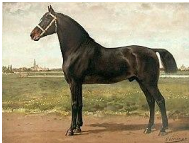
Het Groninger paard.

De meerderheid ziet met tevredenheid terug op de heropstanding van het Groninger paard, dat eens in de twee jaar op Prinsjesdag samen met het Gelderse de gouden koets mag trekken.